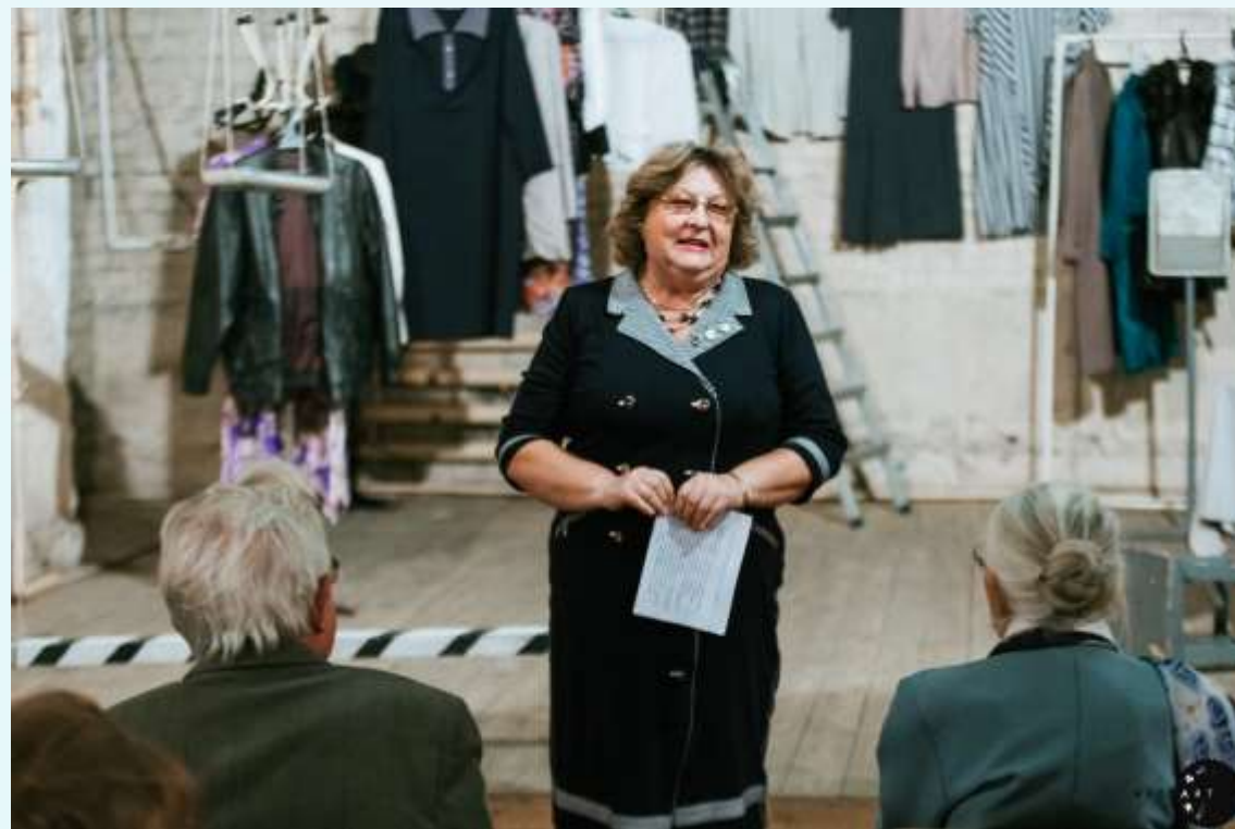
В театре «На тихой улице», 2015 г.