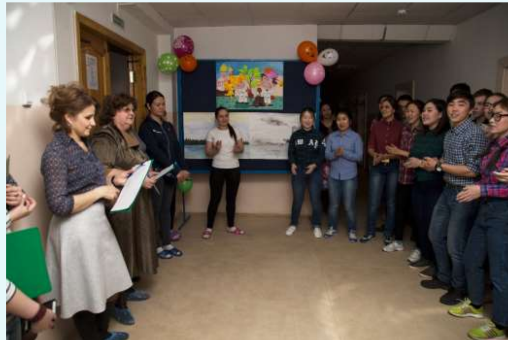
Смотр студенческих общежитий, 2017 г.