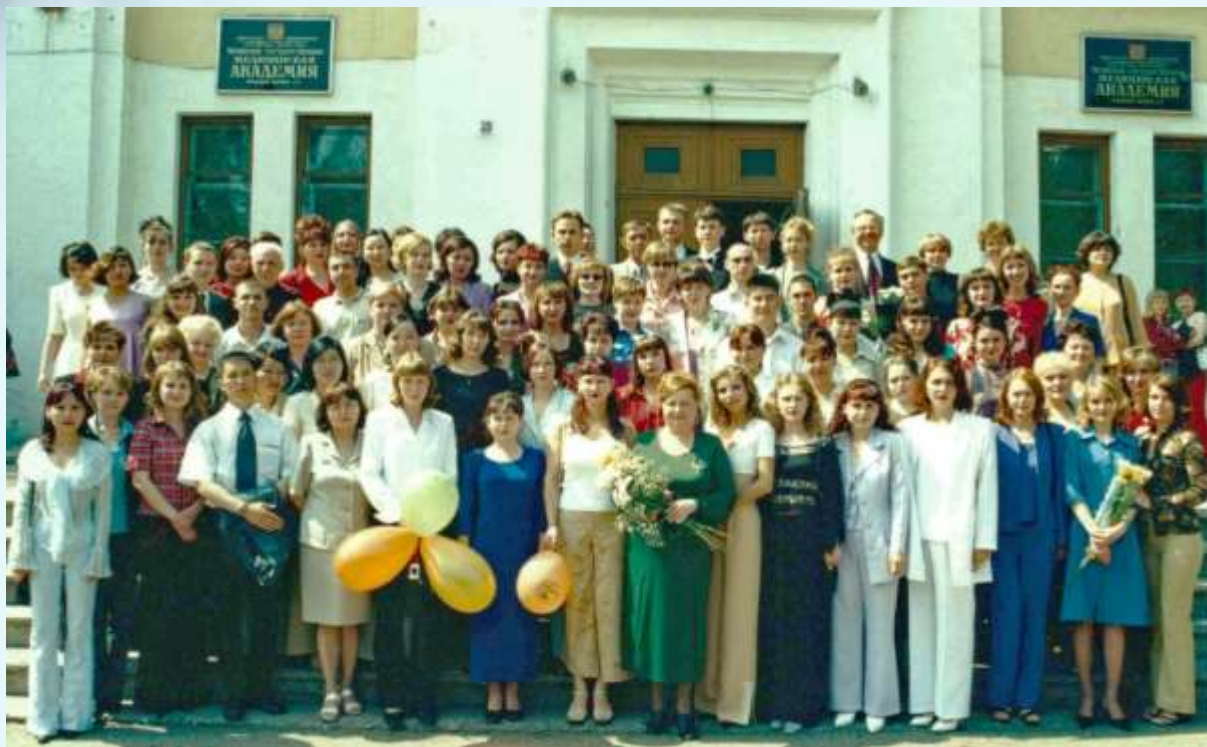
С выпускниками, 2002 г.