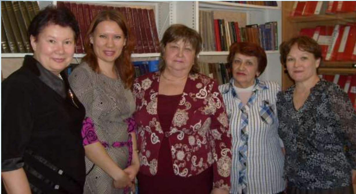
С сотрудниками библиотеки, 2013 г.