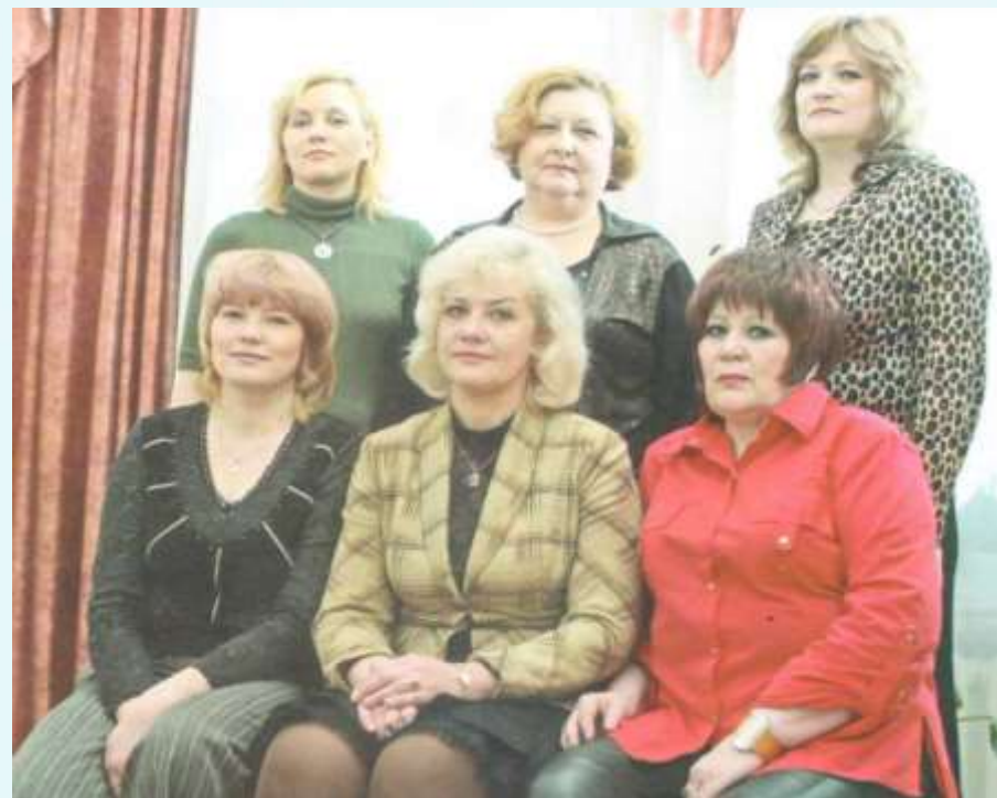
Сотрудники кафедры микробиологии в разные годы