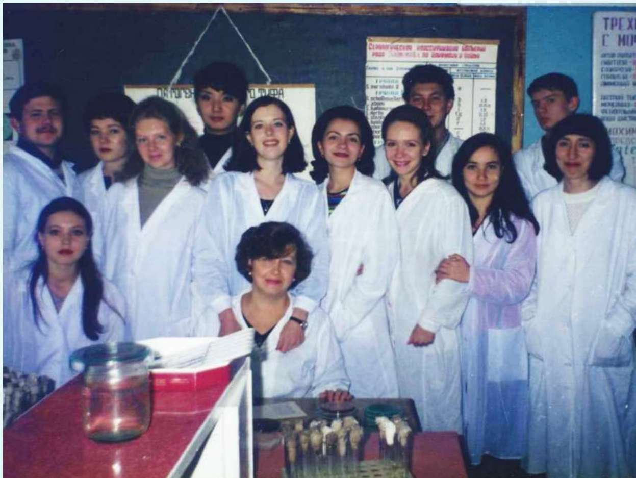
Со студентами 244 группы