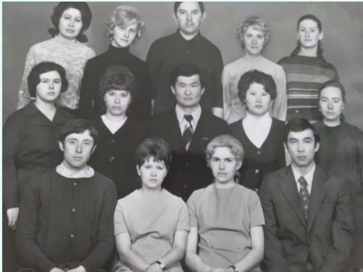
6 курс, 1974 г.